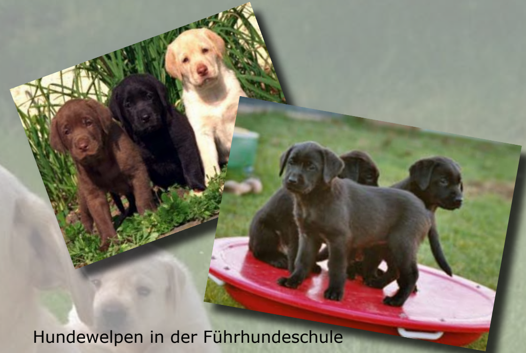
Hundewelpen in der Führhundeschule